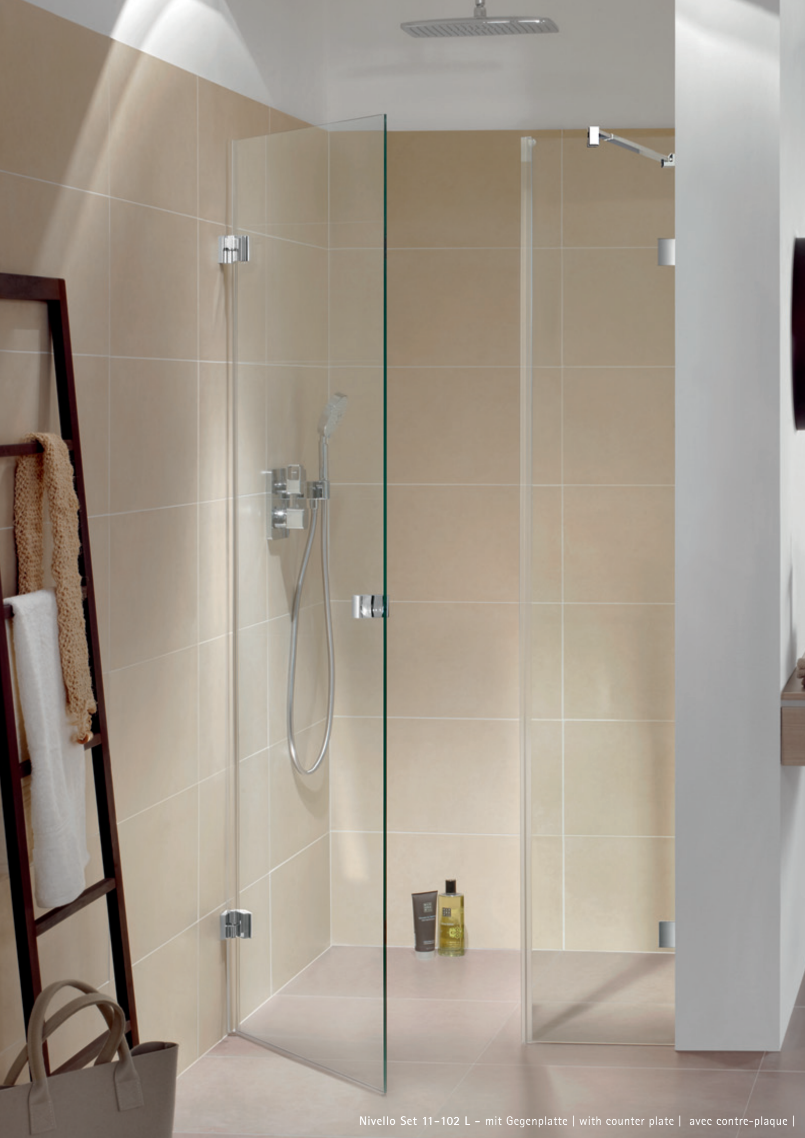
Nivello Set 11-102 L - mit Gegenplatte | with counter plate | avec contre-plaque |